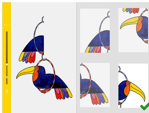
Ergänzen (Stufe 1): Diese Aufgabe ist auch für kleine Kinder gut zu bewältigen. Das ermutigt!