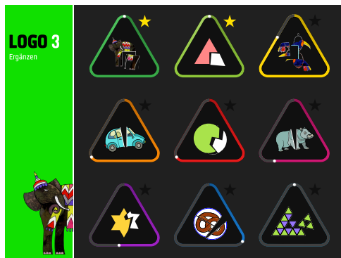
Übungsauswahl und Lernjournal. Die farbigen Linien zeigen den aktuellen Lernstand jeder Übung. Ein Stern heisst: Alle Stufen der Übung perfekt gelöst.