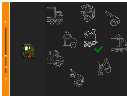
Ergänzen (Stufe 2): Die Farbe in der Aufgabe unterstützt bei der Suche.

LOGO unterstützt und fördert Kinder im Alter von 3 bis 7 Jahren in der Entwicklung kognitiver Kompetenzen und stärkt sie damit spielerisch und sprachfrei für einen erfolgreichen Eintritt in die Schule. Wer die 9 Module meistert, ist bestens vorbereitet für den Start mit Lesen, Schreiben und Rechnen.